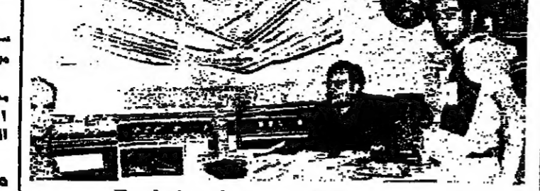
وفي الضمام مقلنا في ارضي المحل وعلى الرصيف

وقدر الخبير الحاج الهام كريمة اضرار بصورة تقديرية بواقع مليون ليرة ، وقال ان الاجرة والتكوير التي اخطاها التجار في محل الشيطيني تساوي ، حسب مسعر الشيطيني